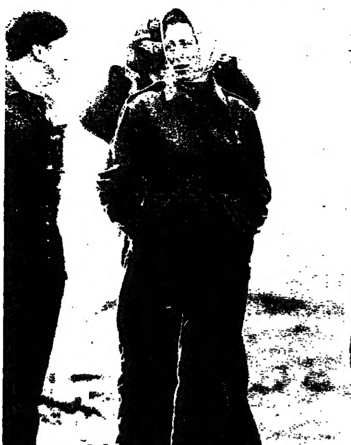
الاميرة المصحة، تحمي انطباعاتها بعد المتابعة بالخيبة الحية